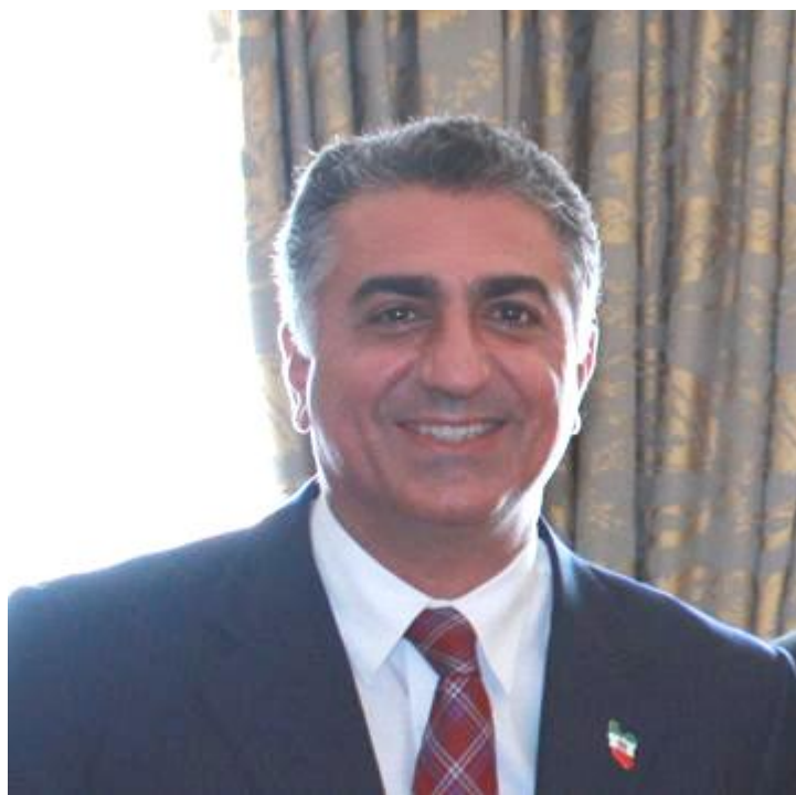
شهريار ايران رضاشاه دوم - كورش پهلوی